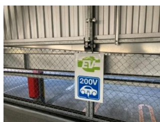
【充電サービス提供場所の標示】

※4. 固定価格買取制度（FIT）対象の再エネ電力の再エネ価値を証書化した非化石証書の中でも、再エネ価値の由来となる再エネ電源が特定されているもの。