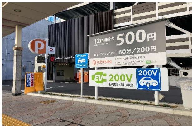
【再生可能エネルギーによる電気自動車充電サービスを 導入する駐車場「D-Parking 浜松ゆりの木通り」】